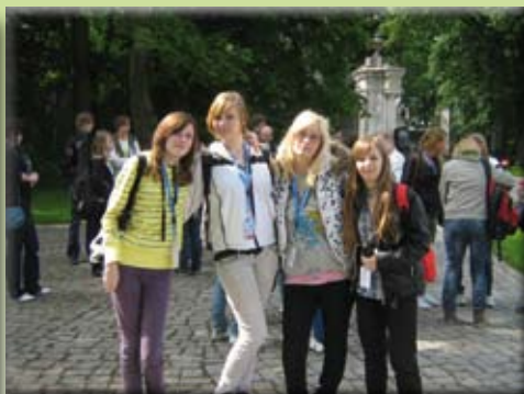
A lengyelországi Kozłówka kastélynál

Az első évben így 19 diákunknak adatott meg a lehetőség, hogy megismerkedjen más nemzetek kultúrájával, életstílusával, első kézből, az ottani családnál elszállásolva.