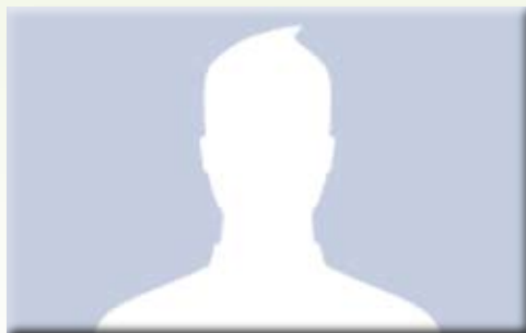
Még nem tudni, ki lesz a 7 szerencsés

A projekt kétéves, tehát jogosan merül fel bennetek a kérdés, mi vár ránk a 2010/11-es évben. Novemberben a spanyol Collado Villalba városkát látogatjuk meg 7 diákkal. Egy újabb feladatot kell az 5 napos útért teljesíteni – megadott feltételek mellett egy színes, több lapból álló „kulturális szótárt” kell varázsolni. Valamint az utolsó megméréttetésben – a többnyelvű színjátékban – való részvételért szintén kijár az utazás.