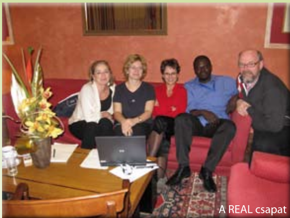
A REAL csapat

Szeretek utazni. Meg embereket megismerni. És szeretem a gimnit. Szerintem ez nagyon jó kombináció ahhoz, hogy jó dolog süljön ki belőle nekem is, meg a sulinak is. Két évvel ezelőtt, pontosabban 2008 nyarán benyújtottam kérvényemet egy szemináriumra Mallorcára (ott még nem voltam, és hát ki ne szeretne odautazni teljesen ingyen) és láss csodát – kérvényemet elfogadták! Utazásom célja nem csupán önző igényeimet szolgálta, hanem kapcsolatot mentem teremteni más országok iskoláival, hogy aztán egy esetleges projektben vehessünk részt. Nem szaporítom tovább a szót – csakhamar egymásra találtunk a számotokra már ismert holland, lengyel, spanyol és norvég iskolák képviselőivel, és pár nap alatt kirajzolódott a közös projekt szervezete, amelyet REAL-nak neveztünk el (Raising European Awareness through Languages).