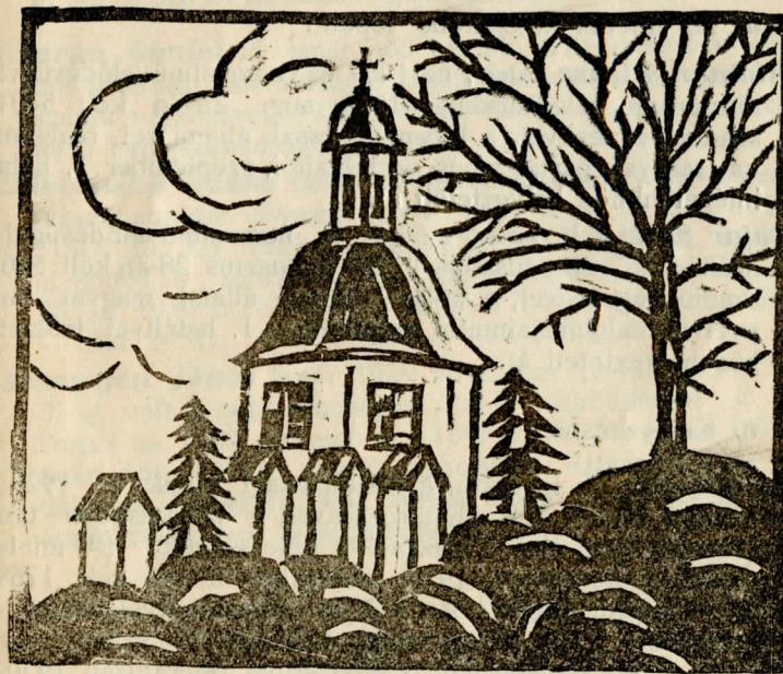
A kálvária kápolnája a régi Forgách bástyán. Mészáros Imre U.b. linometszete

A várnak nem volt hosszú az élete. Amikor 1571. július 7-én a császári biztosok gróf Salm Miklós, Zserotin Frigyes és Proznovsky Primiszló megtekintették Verancsics építkezését, már közölték is az érsekkel, hogy a haditanács nem tartja fenntarthatónak a Nyitra balpartján épült léki várat és az érsekkel együtt a Nyitra jobbpartján, szemben a léki várral ki is szemelnek egy alkalmasabb helyet az új vár számára.**) A léki vár mögött, annak védelme alatt a morva rendeknek anyagi támogatásával megkezdik a mai Érsekújvárnak építését és Istvánfy az 1580. évben arról emlékezik meg, hogy a párkányi török már ezen újabb várat akarta csellel elfoglalni, de nem sikerült neki.**)